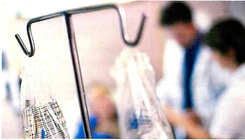
רופא לא מנוסה קיבל את ההחלטה ללא בקרה

ועדת הבדיקה גם מציינת בדו"ח שחיברה כי פרוטוקולי הטיפול של רשת "טרם" לא נותנים מענה מספק לילדים במצבי חירום. "התרשמנו שהפרוטוקולים של רשת טרם לא יכולים לתת מענה למצבי הקיצון ברפואת ילדים וקיים קושי לזהות את חומרת המצב של הילד.