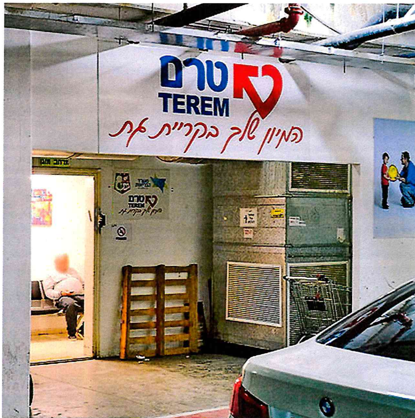
סניף רשת מוקדי החירום בקריית גת