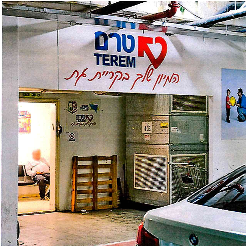
"טיפול נכון היה מונע את פטירת המנוחה", טרם קריית גת