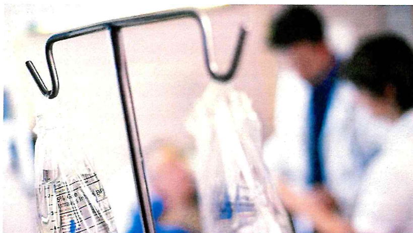
"לא בוצעו בדיקות חיוניות כגון לחץ דם"

צוות מד"א שהגיע לבית המשפחה ניסה גם הוא לבצע בילדה פעולות החיאה. במהלך הניסיונות, חזר לפעול לבה של הילדה, אך פסק זמן קצר לאחר מכן. נוגה פונתה לבית החולים ברזילי, שם נקבע, למרבה הצער, מותה של הילדה.